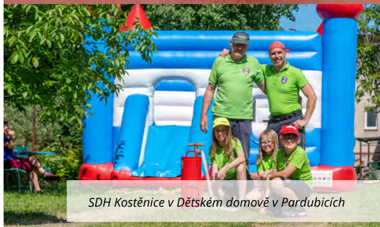
SDH Kostěnice v Dětském domově v Pardubicích