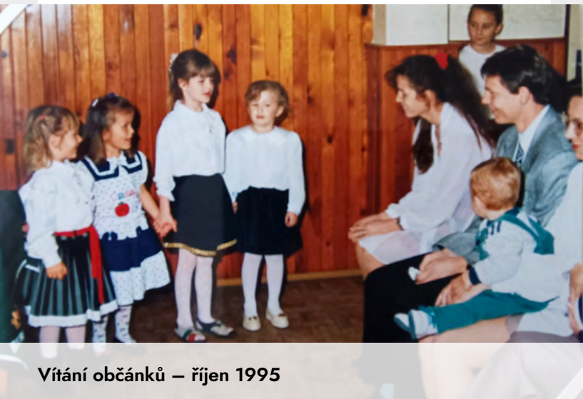
Vítání občánků – říjen 1995

2) Velká rekonstrukce střechy na budově MŠ – odstraněné staré krytiny a vazby, nová vazba včetně rekonstrukce komínů a nové střešní krytiny Bramac.