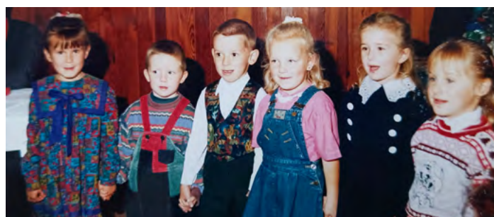
Vítání občáňků – podzim 1997