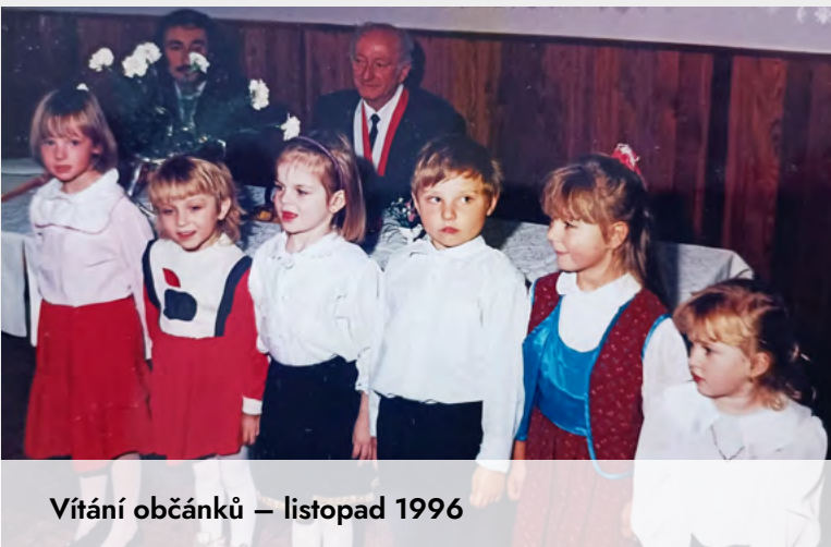
Vítání občáňků – listopad 1996