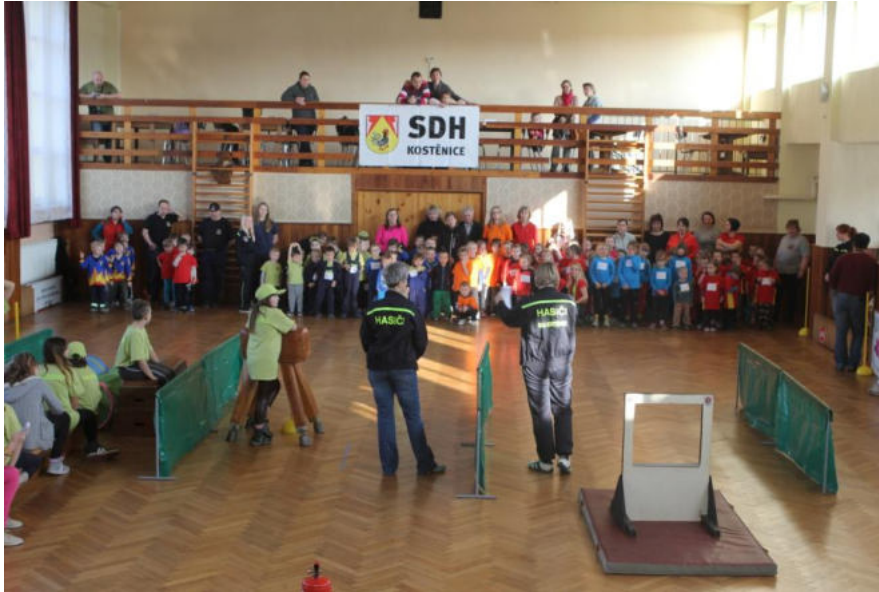
Hravé závodní klání pro nejmenší hasiče.....

Velkoobjemový kontejner a nebezpečný odpad