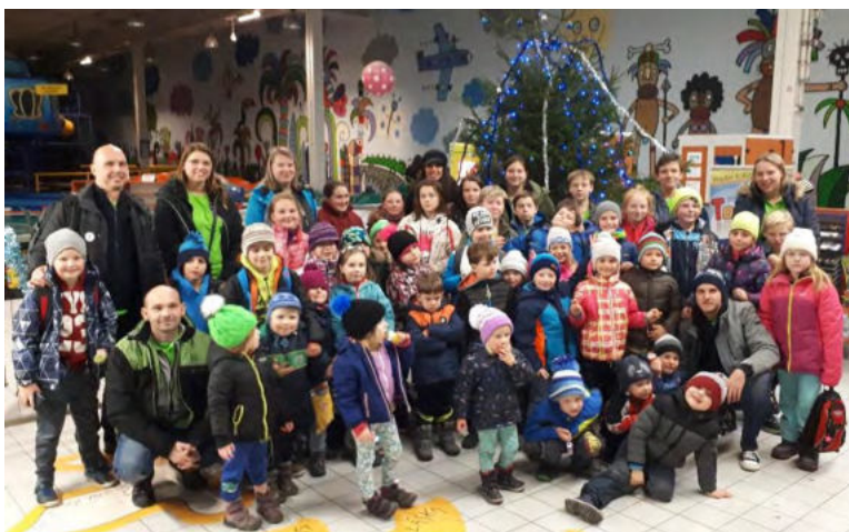
Hasiči v Tongu...